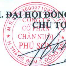
Đình Văn Hồng